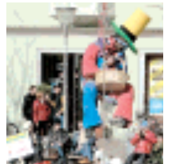
La discesa del pagliaccio