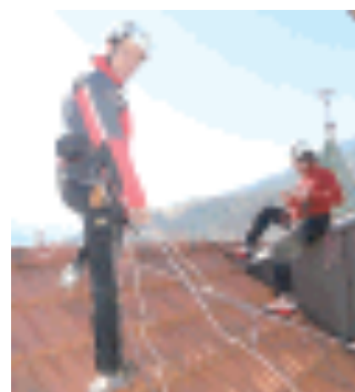
La distribuzione dei piatti di gnocchi. Sopra i volontari del soccorso alpino sul tetto del Comune per calare il pagliaccio