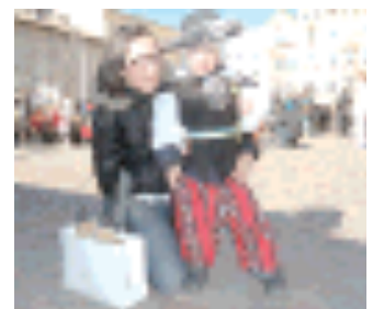
Un giovanissimo pirata